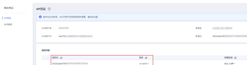
图 17-1 查看项目 ID