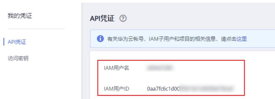
图 17-3 获取用户名和 ID